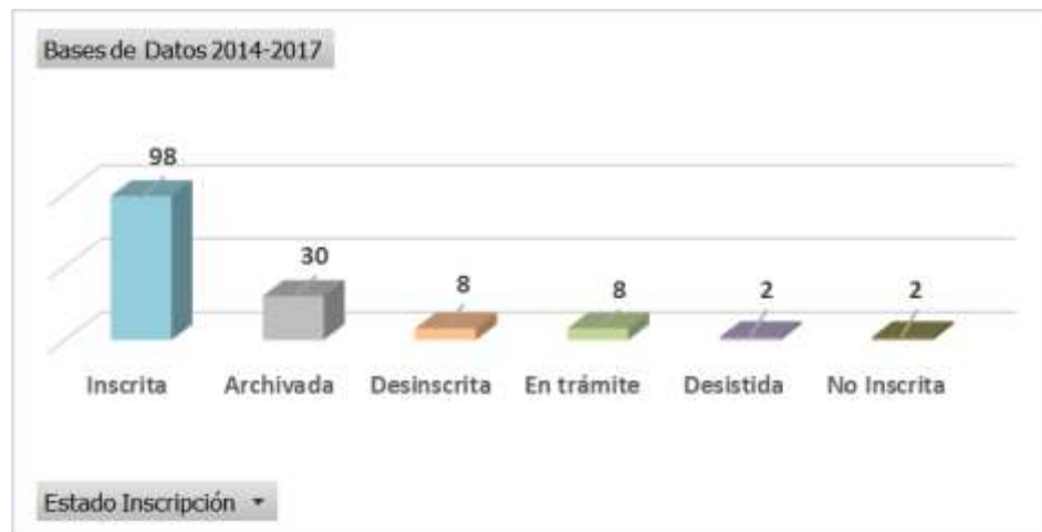
Inscripciones de bases de datos tramitadas en el período 2014-2017

Desde el 2014, noventa y ocho bases de datos han sido debidamente inscritas, dieciséis de ellas se llevaron a cabo el presente año.